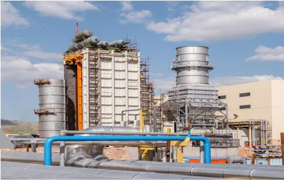
Power Station, DG and Renewable Systems