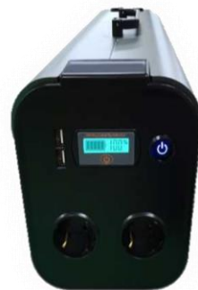
Mini Power Bank