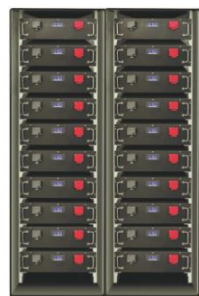
ESS & WATER PURIFIER