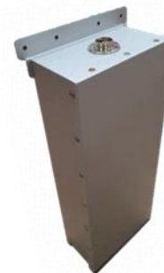
Solar LED Street