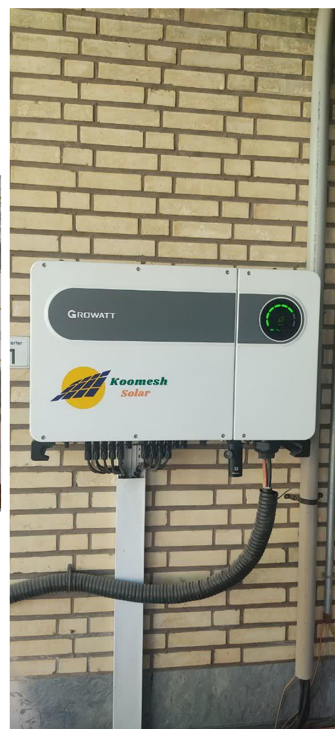
نصب و راه اندازی اینورترهای Growatt