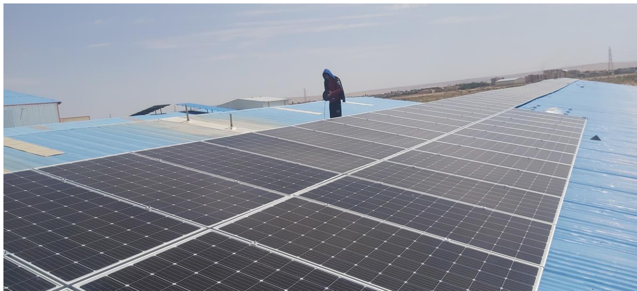
نمونه ای از اجرای نیروگاه روی سقف سوله های صنعتی