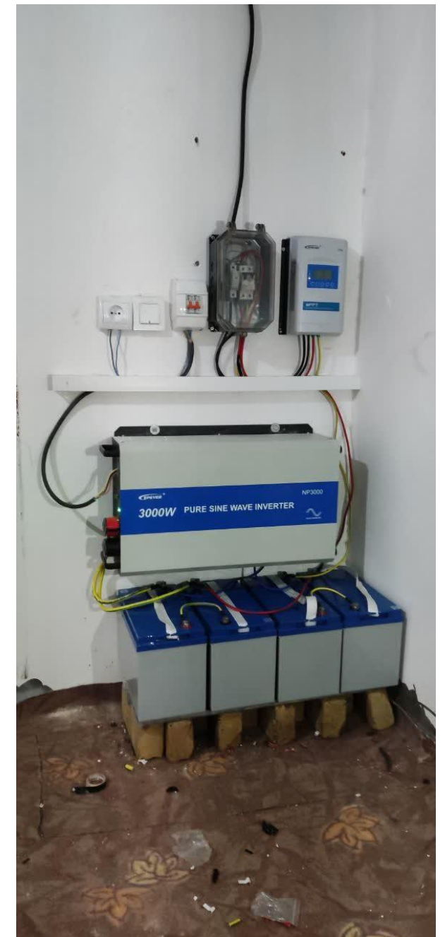
نمونه ای از اجرای نیروگاه های آفگرید و پمپ های سولار