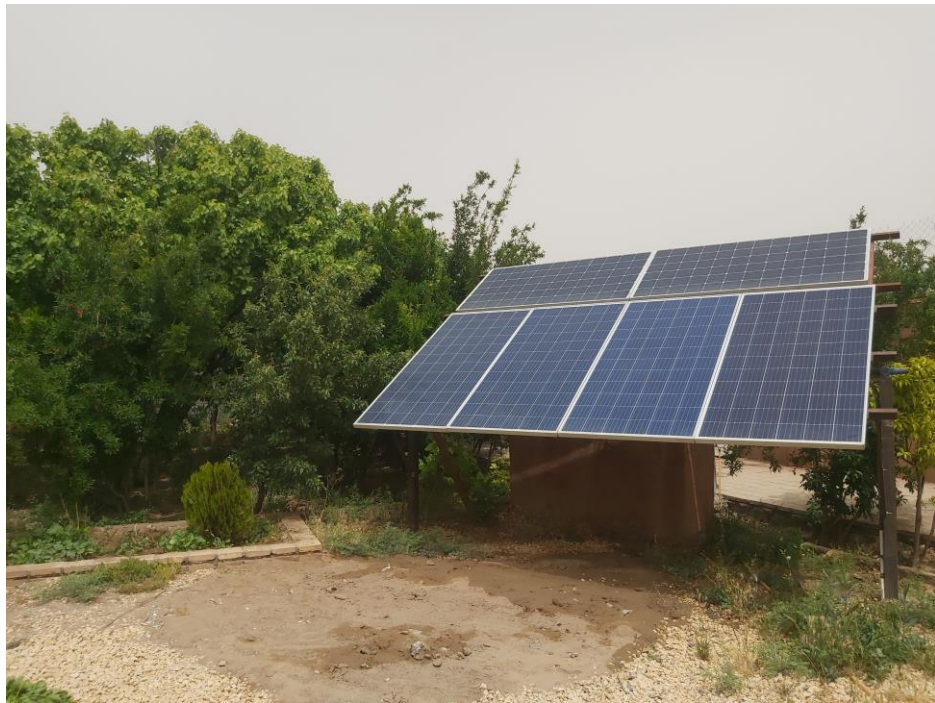
نمونه ای از اجرای نیروگاه های آفگرید