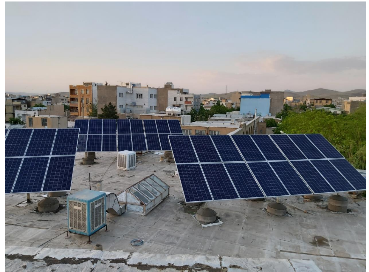
نمونه ای از اجرای نیروگاه های پشت بامی و سقف های گنبدی شکل