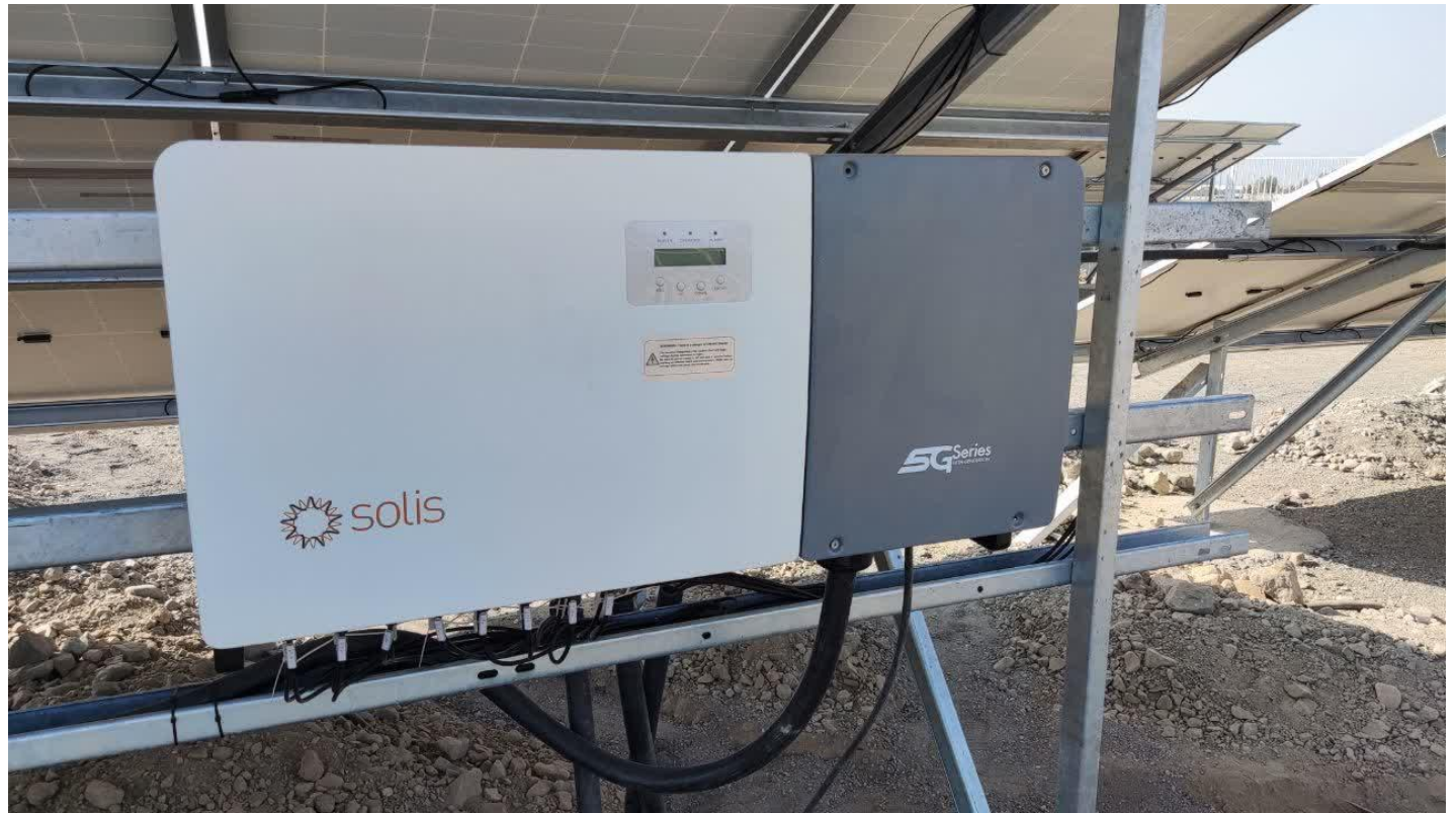
نصب و راه اندازی اینورترهای Solis